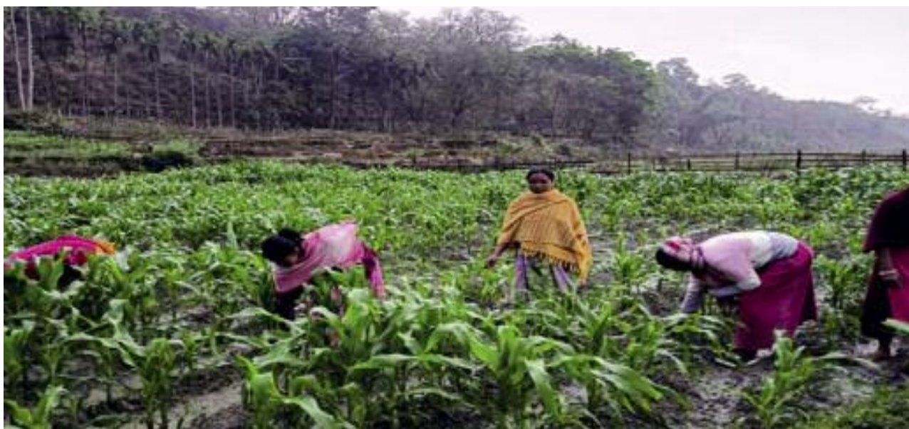
Donne impegnate nella coltivazione del mais nell'agricoltura SAP