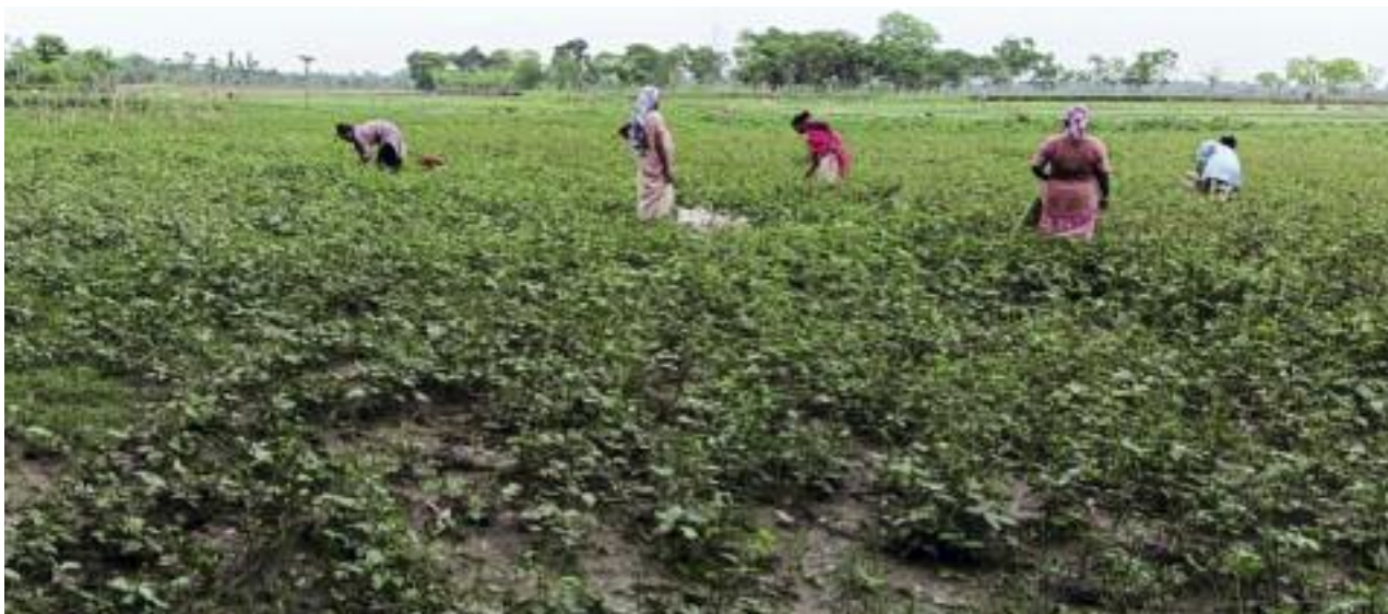
Donne che si dedicano alla coltivazione di alimenti nutrizionali in agricoltura SAP

Inoltre la coltivazione degli ortaggi, non solo garantisce il cibo alla famiglia, ma sostiene anche l'educazione dei bambini generando un piccolo reddito.